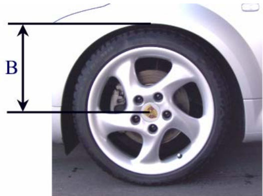
Abstandsmaß B - Radmitte - Kotflügelunterkante

In dieser Tabelle ist die eingestellte Höhe des umgerüsteten Fahrzeugs einzutragen: