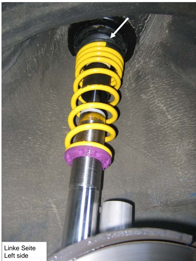
Linke Seite Left side

The upper end of the spring must show towards the left vehicle side.