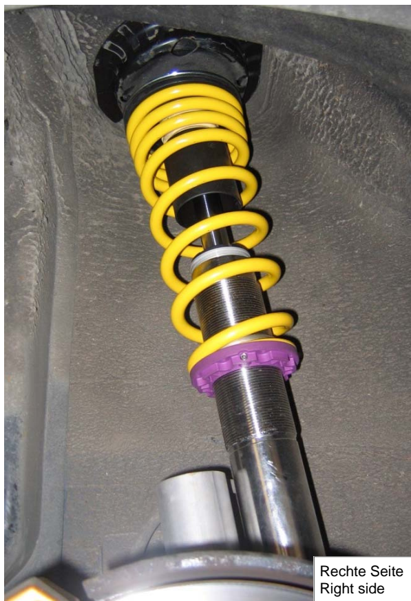
Rechte Seite Right side